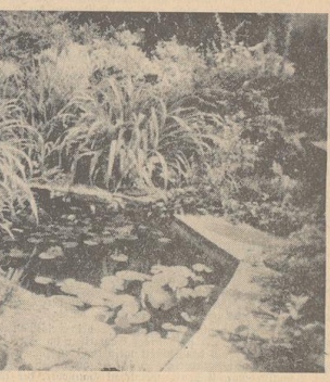
Ein Vorschlag aus der Praxis, wie ihn der Verfasser durchführt