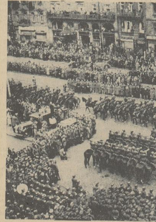
Zur feierlichen Uebergabe des Reichsprotokollrats. Am Mittwoch fand — wie bereits berichtet — in Prag die Einführung Freiherrn von Neuraths in sein Amt als Reichsprotokollrat statt. — Ein Uebersichtsbild über den Wenzelsplatz während der großen Parade, die fast eine Stunde dauerte.