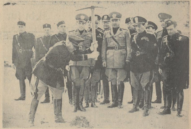
Urbarmachung durch den Duce. In diesen Tagen beendete der Duce seine Reise durch das neapolitanische Land. In Voltorno eröffnete Mussolini die Arbeiten zur Urbarmachung der Sümpfe.