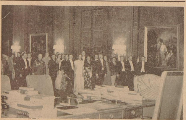
Zum Abschluß des Konzertabends beim Führer zeigte Adolf Hitler seinen Gästen die neue Reichskanzlei. — Unser Bild: Im Arbeitszimmer des Führers. (Siehe Bericht im Innern des Blattes)