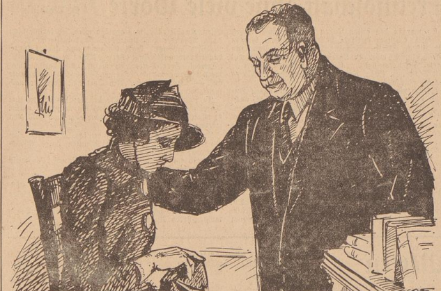
„Gehen Sie nach Hause, gnädige Frau...“

für eine Frau gehöre. Er ging... ich mußte genau, wohin. Es war mir gleich, daß er mich mit einer anderen betrog... nur, daß er mir sprachlich erklärte, nie in eine Scheidung zu willigen, ja, mir sogar drohte. Peter Brud und mich niederzulegen, wenn ich es wagen sollte, die Scheidungsfrage gegen ihn einzulegen — das drohte und wählte in mir! Ich fühlte ich mich so benommen, so mit Füßen getreten und geftern. Als er gegangen war, sah ich den Entschluß, ihn zu töten!“