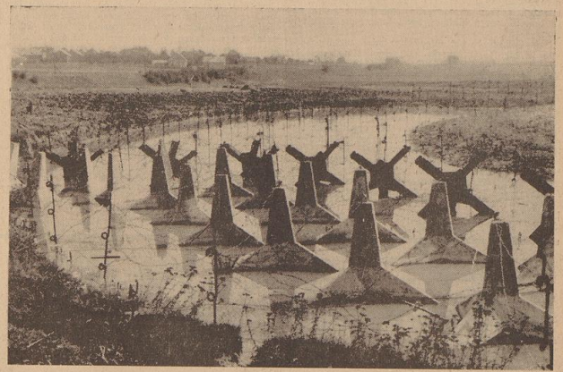
So sah die berüchtigte „Schöber-Linie“ aus! Entlang der deutschen Grenze hatten die Tschechen nach dem Muster der französischen Maginot-Linie die „Schöber-Linie“ angelegt. Oben: Betonhindernisse und Drahtverhau. — Unten: Eine der unzähligen Befestigungsanlagen.