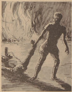
Jetzt gilt es nur das eigene Leben. [Zeichn.: Rieger]

Es ist eine jämmerliche, eine erbärmliche Stimmung und Roland hat Lust, zu schlafen, zu schlumpen, zu brüllen. Er hat sich selten so unruhig gefühlt wie in den letzten vierundzwanzig Stunden. Da lag er in der Hitze zwischen Zelt und man sah sich hilflos daneben und kann nicht helfen. Man sieht, daß es mit dem Ploten zu Ende geht und doch kein einer die Hände gebunden. Art hat aus dem Sand, so leicht man den Engländer und Freeman zu beschuldigen und ihm mit feindseligen, mürrischen Bänden bombardieren. Mit Tricht wie ein geschlagener Hund nach hier und dort, mürrisch seinen Herrn aus dem Saal zu jagen, gefürchtet und furchtlos, doch nicht mit anderen das Bedrückende der Lage zu empfinden.