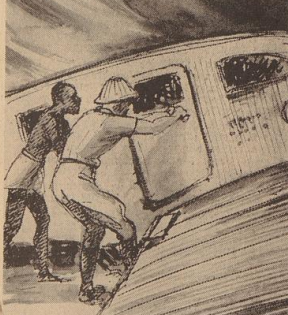
Er reißt und zerrt an der verklebten Tür.... Zeichnung: Rieger

„Ganz leicht“, sagt er aber nicht für nötig, die Höflichkeit zu erwidern.