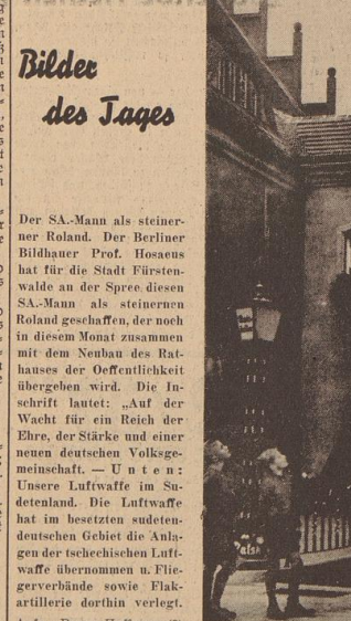
Der SA-Mann als steinerne Roland. Der Berliner Bildhauer Prof. Hosaeus hat für die Stadt Fürstenwalde an der Spree diesen SA-Mann als steinernen Roland geschaffen.