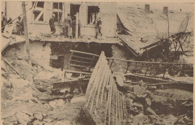
So häuften die Tschechen! In diese Verwüstungen der Tschechen in Graslitz kehrten die sudetendeutschen Flüchtlinge zurück. So fanden sie ihr Zuhause wieder...