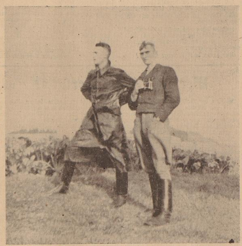
Zwei Männer des Freikorps; der Verfasser des vorstehenden Berichts ist der Freikorpsführer des Lagers Friedland.

Eigentlich sollten wir einen Flüchtlingstransport von Nienburg abholen, aber durch einen Unfall fiel unser Transport aus, und so kam es, daß wir am Mittwoch, den 28. September, im Freikorpslager Friedland unweit der schifflosen Kolksee bei Wardenburg eintrafen — und durch einen weiteren Unfall dem Freikorps ausgetrieben wurden. Unsere Kraftwagen keult durch die pechschwarze Nacht auf die fischschwarze Straße. Die Freikorpsangehörigen sind alle schlaftrunken, als wir die Straße betreten, während die Wächter wachbleiben. Wir steigen aus und leuchten mit einer Taschenlampe die Straßensperre ab, die quer über die Straße gelegt ist. Wir befinden uns in einer Gasse, die sich nach rechts nach rechts wendet. Links durch ein Gäßchen verläuft die Straße zur Kolksee hin ab. Ein Kilometer links ist ein Wald, der sich in die Richtung Wardenburg erstreckt. Die Straße ist abgeblendet. Ein Soldat der Grenzwehr bringt uns zum Zollpostamt.