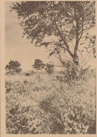
die sie sonst mit viel mehr Heilmitteln besorgen. In Weiden, nur dem Auge des Kenners deutlich bemerkt, ist die Kleingärtner den Wanderer zu, die sie bald in Strömen Tag und Nacht erfüllen werden. Lacht es noch einige Tage später sein und aus dem regen- und nebeltröpfelnden Nachhimmel werden die hellen Rufe der stehenden Weidenröschen dringen. Dann wird die Ernte im Hütchen sein, und die Zeit der Ernte ist zu Ende.

Die Ernte der im Reichsbund zusammengefaßten Kleingärtner (900 000) erbringt alljährlich rund 640 Millionen Kilogramm Obst und Gemüse, d. h. wenn man es einmal biblisch darstellen will, 850 Eisenbahnzüge mit je 50 Waggons. Allein an Obst kommen aus den Kleingärten 350 Millionen Kilogramm. Das sind Zahlen, die eindeutig den Wert der Kleingärten für die Volkswirtschaft beweisen. Zwei Drittel der deutschen Bevölkerung lebt heute in der Großstadt, um so notwendiger ist es, daß man sie so weit wie möglich dem Lande wieder verbunden macht. Dieses kleine Stück Land, das der städtische Mensch nach seiner Arbeit bebauen kann, auf dem er Sonntagsspaß findet, ist unentbehrlich, denn er im Herbst seine Ernte einholt, dieses Stückchen Land erlegt ihm alles das, was ihm die Großstadt nicht geben kann. Selbster eines Kleingärtner ist ein kleiner Bauer, der in der freien Natur seinen Garten, Bäumen und Wegen ein Stück Heimat sein Eigen nennen zu können, das seine Hände betrauen und dessen Ernteertrag ihm gehört. Sätten nur recht viele Kleingärtner, es würde wahrscheinlich die Zahl derer sehr schnell wieder wachsen, die mit heimischen wollen aufs Land, auf dem die Generationen vor ihnen noch so haue waren.