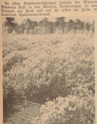
In allen Himmelsrichtungen jenseits der Mauer des Meeres liegt in den Mooren, Niederungen, an den Grenzen zur Heide und auf ihr jeder die Heide in vollem Spätherbst.

Die Ernte blüht allenthalben — Die Immen haben ihre heißesten Tage