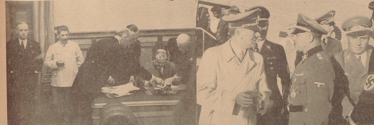
Links: Die Unterzeichnung des Nichtangriffspaktes Berlin — Moskau. Im Krenel wurde im Beisein Stalins und des deutschen Botschafters in Moskau, Graf von der Schulenburg, der Nichtangriffspakt zwischen Deutschland und der UdSSR, von Reichsaussenminister von Ribbentrop und dem russischen Außenminister Molotow unterzeichnet. — Unser Bild: Außenminister Molotow unterzeichnet den Vertrag. Links: Reichsaussenminister von Ribbentrop, Stalin, Unterstaatssekretär Gans, Legationsrat Pflüger, Außenminister Molotow und Botschafter Graf von der Schulenburg. — Rechts: Der Führer wieder in Berlin. Donnerstag nachmittag traf der Führer wieder in der Reichshauptstadt ein. Der Führer nach seiner Ankunft auf dem Flughafen Tempelhof. Hinter dem Führer Obergruppenführer Schaub, rechts 4-Obergruppenführer Sepp Dietrich und Reichsleiter Bornemann.