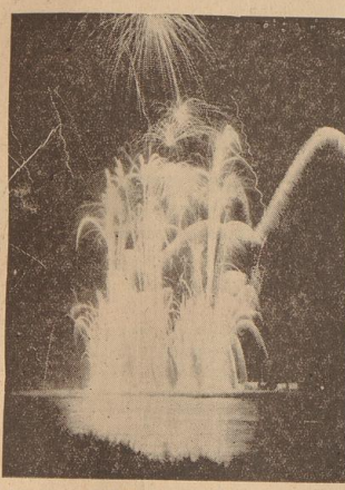
Kometen un Raketen, Springdivels un Luftpoggen

Na fierabend is vondaag fütüabend! Bremen, 12. August