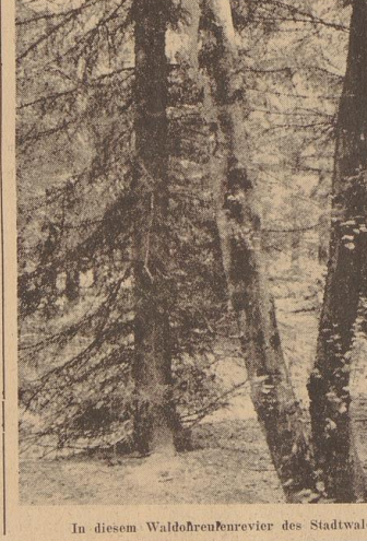
In diesem Waldohrenrevier des Stadtwaldes fanden sich ganze „Beete“ mit Gewällen

Als der Partmeister sah, welchen Dingen unter anderem die Eule, führte er uns in den Stadtwald und zeigte uns ein kleines Waldstück, dessen mittelförmiger und vor der herrlichen Laubentwürfelung nordwestlicher Nadelbestand auch ein helllicher Tag eine geheimnisvolle Dämmerung verbreitet. Und siehe, der unter dem Wald war die überflutet von diesem hellgrünen Speiballen. Hier war das Reich der häufigsten unserer Bürgerpark-Eulen: der Waldohreneule, die hier im Waldhain ihren Tag verbringt. Ihr Speisetzettel ist nicht so abwechslungsreich wie der der Schleiereulen, aber auch hier kamen sie zum Vorschein, die Rippen der kleinen Vögel, die Schädel der Spitznasen mit ihrem Miniatur-Raubtiergebiss, die gelben freisenden Nagezähne und das gierliche Nagegebiss in den schwebend gebelichten Kiefern der hochstehenden Zweigbüsche in Wald und Heil. Sie dort bietet, Haus halten lernen, das können wir auch noch am Beispiel der Natur! Da ist ebenfalls alljährlich in den Wäldern der Gebäude der Dölschbauer