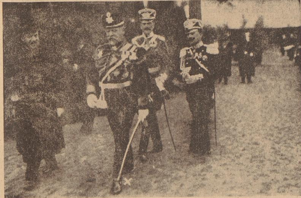
Kriegsminister Suchoinin (X) bei der Grundsteinlegung der russischen Gedächtniskirche in Leipzig 1913

Über, der in diesen Geheimbund eintritt, erhielt fortan eine Nummer und mußte folgenden Eid schwören: Ich, N. N., schwöre, indem ich Mitglied der Organisation 'Mehnjenski H' werde, daß der Name, die mich ernannt, bei der Erde, die mich ernährt, vor