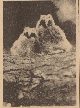
Waldohrenkinder aus dem Bürgerpark. Der Größenunterschied zwischen dem ältesten und jüngsten der Geschwister aus einem Horst ist — da die alte Eule bereits vom ersten Ei an fest brütet — sichtbar erheblich.

In einem Scheunengeliebter der Gebäude der Parteiverwaltung brüht seit Jahren ein Schleiereulenpaar, das sich dort unweit des Schweizerhäuschens ungestört und wohl fühlt. Wie alle Fleisch- und Allesfresser unter den Vögeln