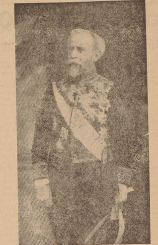
Dr. ... Paul Cambon Hochgradfreimaurer, Französischer Botschafter in London, Sprecher des „Großen Orientes“