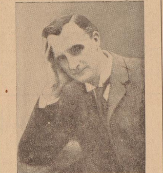
Br. ... Sir Edward Grey, Hochgradfreimaurer, Staatssekretär des Auswärtigen, Sprecher des „Großen Firmaments“

Die Freimaurer hatten, geht aus den Berichten hervor, die an dem „Collège White“ in Paris das Hauptquartier für die südlichen Tugend der russischen Intelligenz befehligt wurde, geflohen Emigranten hielten die fast durchwegs Freimaurer waren.