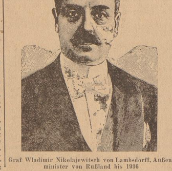
Graf Vladimir Nikolajewitsch von Lamsdorf, Außenminister von Rußland bis 1906

Wenn jemals in der Geschichte, dann hat die Freimaurerei in Rußland ihr Meisterstück vollbracht, indem