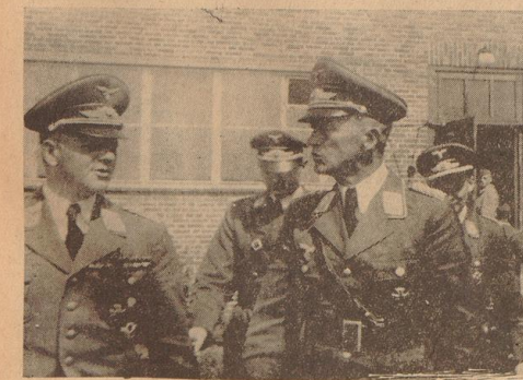
UNSERE BILDER: Oben: Generaloberst Milch (links) und der Chef der Luftflotte 2, General der Flieger Felmy. — Rechts nebeneinander: Flak leistet ganze Arbeit. Unser Bild zeigt eins der schwer getarnten Flakgeschütze in Feuerstellung.

Am 5. August sind 25 Jahre vergangen, seit das deutsche Seebüderdampf „Königin Luise“ nach Erfüllung seiner Aufgabe als Minenleger vor der Themelmündung im letzten Feuer englischer Kriegsschiffe unterging.