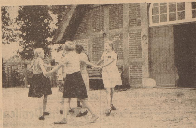
Lustiger Ringelreihen in Eggstedt.

Bei guter Verpflegung und sorgfältiger Betreuung durch Kindermädchen und teilweise auch einige hilfsbereite Mütter verbringen die Kinder unbeschwerter Ferientage, die dazu bisher meist von ihnen weiter benötigt waren, so daß der eigentliche Zweck der Erholungszeit, die Kräftigung durch den Aufenthalt in gesunder ländlicher Umgebung, liberal zufriedenstellend erreicht werden konnte. Dazu kommt die regelmäßige Tageseinteilung mit ihrem abwechslungsreichen Wechsel von Spiel und Ruhepausen, das auch auf das kindergemäß nachhaltig wirkende Erlebnis einer schönen Natur inmitten einem dem Stadtbild neuen, vor immer neue Entdeckungen reichenden ländlichen Arbeitsgebiet — kurzum, es sind herrliche Ferienwochen, die keinem zu lang werden, wie wir uns bei einem Besuch in Eggstedt überzeugen konnten.