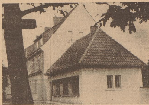
Schmuck gliedert sich das kleine Dienststellen-Gebäude in das Straßenbild ein.

In diesen Tagen erhielt die bisher im Gebäude des untergeordneten Dienststelle der NSD.-Ortsgruppe Industriehafen einen modernen Neubau, unmittelbar an der Ostseehausler Heerstraße, zugezogen. Es handelt sich um ein an der Straßenseite am Fußberg für die neuangelegte Geschäftsstelle mit insgesamt nur drei Räumen, die in folgender Weise eingerichtet wurden: Der erste Raum ist den Abteilungen Propaganda und Organisation vorbehalten, im zweiten Raum befinden sich der Arbeitsplatz des Gruppenamtsleiters und die Dienststelle des Hilfsverkes „Mutter und Kind“, der dritte Raum beherbergt Kasse und Jugendhilfe. Ein angelegter Kraftwagenunterstellraum wird als Lager und Ausgabestelle benutzt. Seitens der Kreisamtsleitung wurde dem Gebäude eine entsprechende Ausstattung mit allem Notwendigen für die Dienststelle zu einer leichten und freundlichen Stätte der Arbeit werden ließ. Neben den Hinweis-Tafeln sieht man an den bis zum Erdboden reichenden Außenwänden den Hakenkreuz der Partei sowie das NSD. und WSA-Zeichen. Man sieht fern die Mahnworte: „Ein Wort hilft sich selbst“, „Sei Sozialist der Tat“ und „Vorsorge an der Wiege des Lebens“.