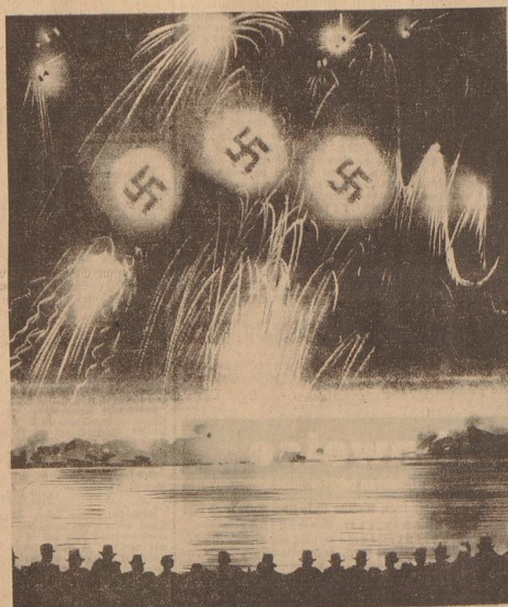
Zeichnung: F. Schoppa

Das nun uns bereits wie, behält angelegentliches Feuerwerk am morgigen Abend wird wieder auf dem Babstrand gegenüber der Siedwallfähre abgebrannt. Mit dem Abbrand des Feuerwerks um etwa 21.30 Uhr zu rechnen. Die Absperrung erfolgt ab 19 Uhr. Sie wird auf der Osterdeichseite vorgenommen, vom Alten Wall bis Bremer Kampbahn, Höhe Berdener Str. Das Parzellengelände auf dem Waber wird abgeperrt ab Wasserwerk. Söbde Bremer Ruderverein. Sämtliche Parzellisten können ab 19 Uhr die abgeperrten Auen nur gegen Vorlegung des Parzellistenausweises passieren. Es wird ausdrücklich darauf hingewiesen, daß die Abperrmannschaft angewiesen ist, niemand ohne Ausweis durch die Abperrung gelangen zu lassen.