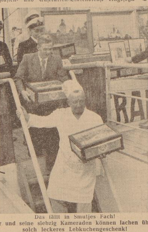
Das fällt in Smutjes Fach! Er und seine selbst Kameraden können lachen über solch leckeres Lebkuchengeschenk!