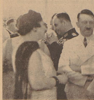
Abendempfang beim Führer zu Ehren des bulgarischen Regierungschefs.

schliehender der Erwartung Ausdruck, daß auch dieser Besuch beiden Völkern weiter zu vertiefen.