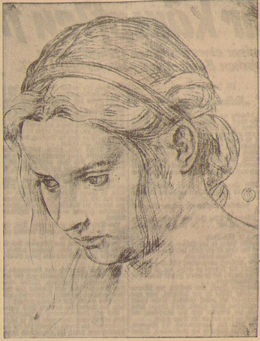
BILDNIS EINER JUNGEN FRAU / Andrea del Sarto (Delike M)