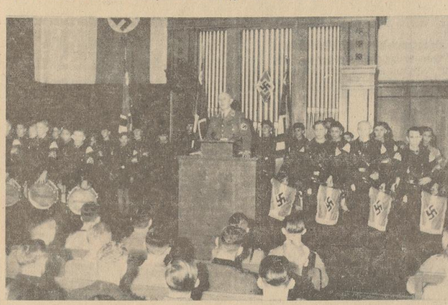
Der Appell unseres Kreisleiters an die Jugend

Appelle der Jugend in allen Bereichen der Bremer HJ-Stämme zur Schieß- und Geländekundenausbildung