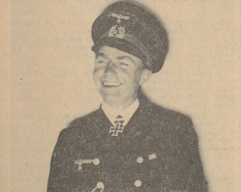
Kapitänleutnant Prien mit dem Ritterkreuz des Eisernen Kreuzes, das ihm vom Führer für seine tapferen Tapferkeit bei beiden englischen Schlachtschiffen 'Royal Oak' und 'Repulse' verliehen wurde

Kapitänleutnant Prien bei Göring. Generalleutnant Göring nahm gestern vormittag die Meldung und den Bericht des Kapitanleutnants Prien entgegen.