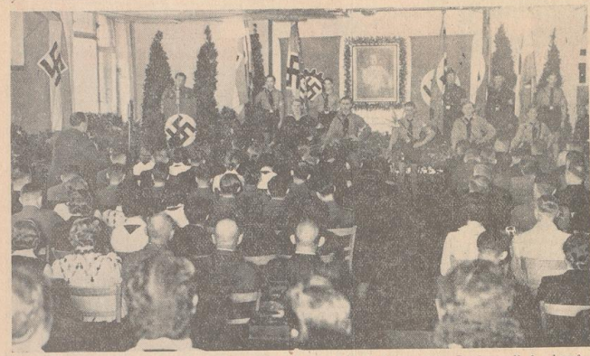
Dritter Reichsjugendappell der schaffenden Jugend. Am Montag früh fand der dritte Reichsjugendappell der herbstlichen Jugend Großdeutschlands statt. Bei einer Feier, die in den Lehrlingswerkstätten der AEG in Berlin-Reinickendorf durchgeführt wurde, sprach Oberbannführer Schröder. (Siehe auch unseren örtlichen Teil.)

Konzertliches Mittelfeld abgibt. In den Rufen von Marzaco bei Varna wurde die Seite eines Offiziers der französischen Kavallerie angepöbel. Aus den Reihen des Zuhörers erhob sich ein Mann, der sich als ein französischer Kavallerieangehöriger handelte. Das Festspiel muß über dem Mittelmeer abgeführt sein, ohne daß der Verlust bisher von französischer Seite festzustellen worden wäre.