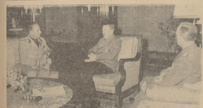
Außenminister Ciano beim Führer. Der italienische Außenminister Graf Ciano beim Führer in der Neuen Reichskanzlei; rechts Reichsaußenminister von Ribbentrop.