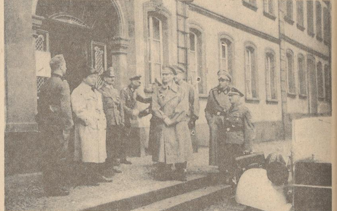
Der Stellvertreter des Führers, Reichsminister Rudolf Heß, in Saarbrücken. Links: Gauleiter Birckel.