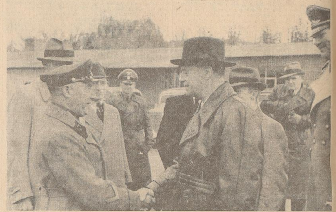
Zur Reise des Reichsaussenministers nach Moskau. Der Reichsaussenminister von Ribbentrop verabschiedet sich von stellvertretenden sowjetischen Militärattaché in Berlin, Brigadegeneral Beljakow; rechts der Chef des Protokolls, Baron von Dörnberg.

Zum General erlauben wir Einzelheiten über den Brückenbau, der eine glänzende Leistung der Pioniere darstellt. An einem Tage wurde die 350 Meter lange Brücke trotz der Schwierigkeiten durch den feindlichen Widerstand und die starke Zerstörung und trotz feindlicher Feuerwirkung fertiggestellt. Von 2 bis 4 Uhr morgens werden in breiter Front beiderseits der Brücke Erdarbeiten für die Brückenbauarbeiten angefangen. Anschließend gehen Teile der Pioniere an das Weidengebiet vor und bringen dort ihre Maschinenwerke in Stellung. Unter ihrem Feuerdruck werden von einzelnen Kompanien die Brückenpfeiler, geeignete Plätze für den Einbau und der Umarmungs für Brückenbauarbeiten erdichtet. Unter den ausgeschwärmten Kompanien können die ersten Brücken-