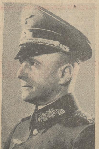
Generaloberst von Brauchitsch