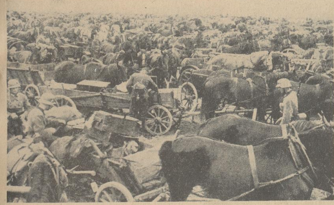
Oben: „Mit Mann und Ross und Wagen hat sie der Herr geschlagen...“