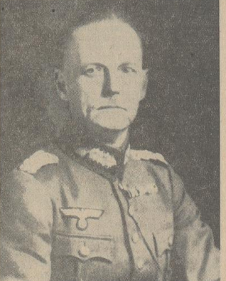
Generaloberst von Rundstedt