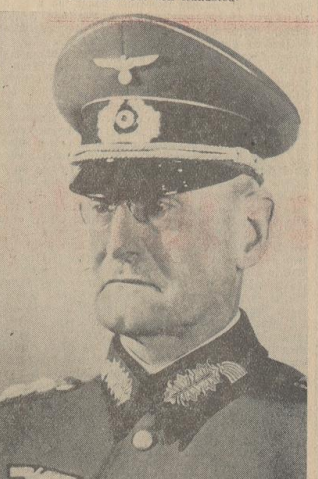
General der Artillerie Halder Presse-Hoffmann (6)