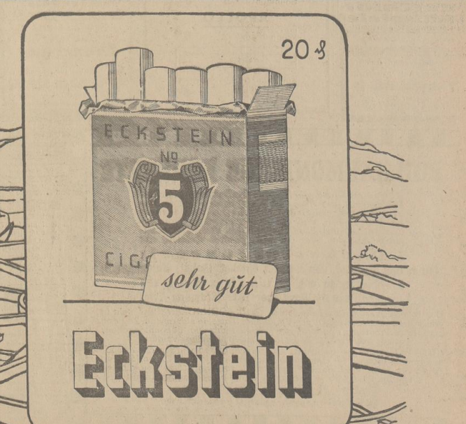
sehr gut Eckstein