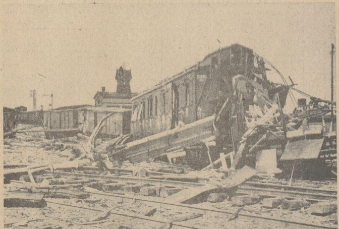
Ein Bild von der Weichselbrücke bei Dirschau, die von den Polen vor ihrem Rückzug gesprengt wurde.