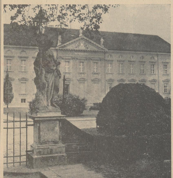
Schloß Bellevue, das Gästehaus der Reichsregierung, wird dem Prinzregenten Paul von Jugoslawien und seiner Gattin während ihres Berliner Besuchs als Aufenthalt dienen.