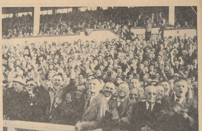
35 000 in der Bremer Kampfbahn. Da sieht es schon so aus wie auf unserem Bild: Kopf an Kopf gedrängt steht die Menge; der beste Beweis dafür, in welchem Maße gerade der Fußball wahrer Volkssport geworden ist.