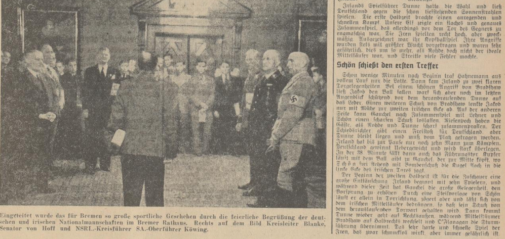
Eingeleitet wurde das für Bremen so große sportliche Geschehen durch die feierliche Begrüßung der deutschen und irischen Nationalmannschaften im Bremer Rathaus...