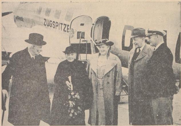
Das unternehmungslustige Jubelpaar nach der Landung in Bremen

Ein unternehmungslustiges Jubelpaar aus dem Oldenburgischen flog Bremen — Hamburg — Bremen