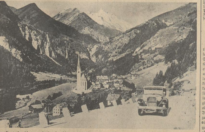
Der Deutsche Alpenverein hat beschlossen, die Naturschutzgebiete in den Hohen Tauern zum Grundstock für einen Deutschen Nationalpark zu erklären. Das mehr als 400 qkm große Gebiet krönt der abgebildete Großglockner mit dem berühmten Ausgangspunkt Heiligenblut.

In Rom wurden am Donnerstag vor rund 600 Nationalitäten grundlegende Erklärungen über die faschistische Rassenlehre im Namen des Duce durch den Staatssekretär des Innern abgegeben. Unterstaatssekretär Puffarini-Gubbi erklärte: „Das Volkchen einer Rassenlehre zu leugnen aus dem einzigen Grunde, um sich trügerische Hoffnungen über die jungen und lebendigen Völker zu machen, ist das einfache und findliche System einer Vogel-Straw-Politik der Demo- kratie, die keine andere Absicht für ihre Befürchtung finden, als den Kopf in den Sand zu stecken und nichts lernen zu wollen. Die Rasse ist nicht, wie sie es gern glauben machen wollen, eine abstrakte, sondern eine politisch-wirtschaftliche Realität der totalitären Staaten. Die Rasse ist eine Realität, die im Blut ihre nicht weg- zudrückenden Gründe findet und eine Idee darstellt, die in der Geschichte der Menschheit gloriose Seiten geprägt hat. Es kann nur versichern, daß in Italien alle rassenpolitischen Maßnahmen des faschistischen Groß- rates und ihre Bestimmungen in der Gefolgung volle und entschlossene Anwendung finden.“