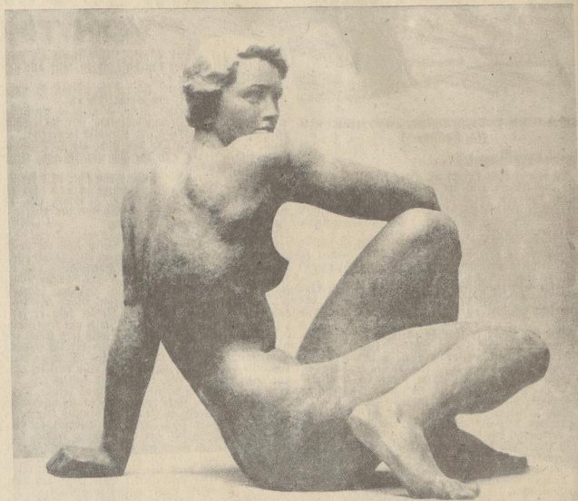
„Die Schauende“ Eine ausdrucksvolle Plastik von Professor Fritz Klimsch. Unsere Aufnahme wurde dem von der „Bromer Zeitung“ bereits besprochenen Bildwerk „Das Antlitz der deutschen Frau“, mit einem Geleitwort von Frau Emmy Göring, entnommen.

Kartoffelstäbchen mit Marmeladenfüße Man bereitet einen Teig aus 500 Gramm gelochtem, geriebenen Kartoffeln, einem Ei, einer Mehlportion, zwei Eßlöffeln Kartoffelmehl und einer Pfefferkorn abgetriebener Zitronenschale. Mit bemehlten Händen flade kühlen formen, die in der Steilplatte goldbraun backen werden. Zur Sahne mit Marmelade in Wasser zerührt, das Ganze zum Kochen abkochen, mit Zitronensaft und Zucker gewürzt und mit Kartoffelmehl gebunden.