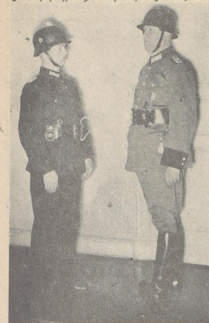
Das Bild links zeigt einen Obermeister der Feuerfahnpolizei in seiner alten Feuerfahneruniform, rechts in der neuen Polizeiuniform.