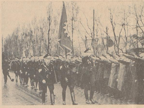
Hemelings erste Goldene Fahne zieht ein! (Aufnahmen: Schmidt (2))

Die Tatsache, daß sich unter den in diesem Jahr vom Führer mit der Goldenen Fahne ausgezeichneten Betrieben wieder die beiden schon im Vorjahr ausgezeichneten Bremer Betriebsgemeinschaften Geb Nielsen — und Dgo-Kaffeebrennerei Oetken & Goedeke befinden, wird nicht nur in den betroffenen Betrieben wieder die beiden schon im Vorjahr ausgezeichneten Bremer Betriebsgemeinschaften haben sich die Wiederverleihung der Goldenen Fahne dadurch errungen, daß sie nicht feilschenden sind bei den Zeitungen, die sie schon vor einem Jahre vorzeigen konnten, sondern sich rühmlich weiter bemühten, den Betrieb zu einem Vollwerk der deutschen Volkswirtschaft und Betriebsgemeinschaft zu machen. Seiden Betriebsgemeinschaften gelten zu ihren Auszeichnungen durch den Führer unsere herzlichsten Glückwünsche.