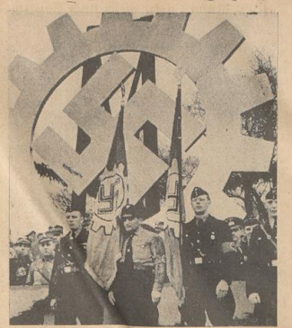
Vor dem mächtigen Symbol der Arbeitsfront: Bremens jüngste Goldene Fahne der Firma Cordes & Graefe (links). — Daneben (rechts): Die bereits zum drittenmal verliehene Goldene Fahne der Reismühlen und Stärkefabrik Geb Nielsen, aufgenommen während der Markkundgebung der Schaffenden Bremens auf der Bürgerweide

Am Gau Weser-Ems wurden weiter mit der Goldenen Fahne der DDF, ausgezeichnet: Deutsche Eisen-