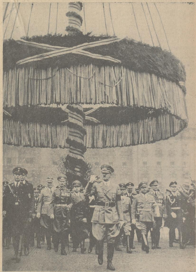
Der Staatsakt am nationalen Feiertag des deutschen Volkes. Der Führer trifft zum Staatsakt am nationalen Feiertag des deutschen Volkes beim Maibaum im Lustgarten ein.

„An gleichen Augenblick, als Adolf Hitler — umsofort von den hitlerischen Freudentagungen — seine Anrede an die deutsche Jugend beginnt, wird ihm noch einmal in besonders eindringlicher und herrlicher Form der Gruß der Jugend zuteil: Was der Führer in besonderer gegenseitigen Seite lesen ist, lagertig zehnjährige von 20-30. Wädel ihre Taten ab und bilden mit ihren