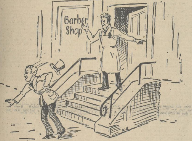
„So, jetzt könnt Ihr Euren Landsleuten daheim erzählen, daß ein amerikanischer Barbier den Sohn des Königs von England aus seiner Wohnung geworfen hat...“

starrten sich der Kaiser da, wie ein Tier, das die Wodwaaffe des Jägers auf sich gerichtet sieht. Da stürzt sich Alexei Dronow auf den Kaiser und läßt ihn zu würgen. Der mecht sich mit verzweifelter Kraftanstrengung, zerstückt dem Gegner das Gesicht. „Was hast du dir getan?“ Orlow läßt von seinem Opfer ab. Hummungen? Zu spät. Schon fallen die Lippen über Peter her, werfen ihn aufs Bett und suchen ihn mit Küßen zu erwidern. Peter kämpft um sein Leben. Er erwidert nicht die Küßen, die ihm den letzten Augenblick seiner Kräfte. Schaurig geht sein Silber durch das einmale Landhaus. Aber niemand erscheint, um ihn aus den Händen der Mörder zu befreien.