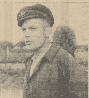
Bewußtlose die Augen auf und wippen die Arme um sich! Er wird sofort zum Arzt gebracht, aber handelt und so weit übergestellt, daß er schon nach acht Tagen wieder zur Schule gehen kann. Heute ist er Gelehrer im Reichsbahnhofsbesetzungswesen.

Ein Botschafter kam einst vor neun Jahren als junger Volkshüter gerade nach zur rechten Zeit an den Teich des Gottfried-Talle-Parkes (früheren Oelschauer Parkes) um verbindlich zu können, daß hier ein junges Menschenleben vorliegt. Der Botschafter hatte am 23. Februar 1930 die Rettung eines Jungen aus dem Eis der Teiches übernommen, er hatte nachmittags fünf vor 17 Uhr seinen Befehlsgang beendet und befand sich auf dem Rückweg durch den Park. Schon auf dem ersten Gang waren ihm mehrere Jungen aufgefallen, die im Nähe des austretenden Teiches Fußball spielten. Als einer der Jungen zum Teich hinüberlief, wurde er plötzlich festgehalten. Er sah schon von weitem, daß in der Richtung, die er ging, die Teiche durch die Luft geschwommen wurden. Nahrung war nicht zu erkennen, da der Teich tief war.