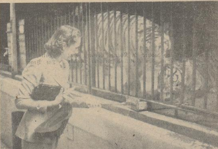
3. Auch der zweite Tiger, der bisher nur kritischen beobachtet, faßt Vertrauen. Er läßt sich in den dicken Halspelz kralen und schnurrt behaglich wie eine große Katze.