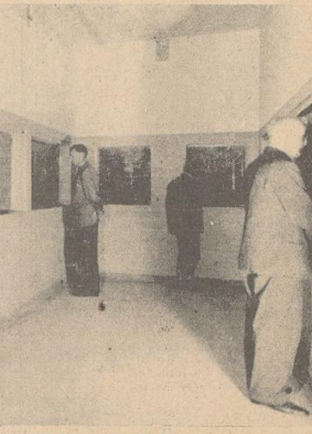
Im Schauraum der neuen Seewasser-Abteilung. Links: Hinter den Kulissen des Groß-Aquariums; Der Bedienungsgang für das neue Helgoländer-Becken.

Aber schon jetzt kann Bremen mit Recht sein Aquarium und Terrarium zu den „großen“ in Deutschland zählen. Hoffentlich wollen die Bremer diese Tatsache durch fleißigen Besuch dieser schönen Anlage zu würdigen. Dr. H. W.