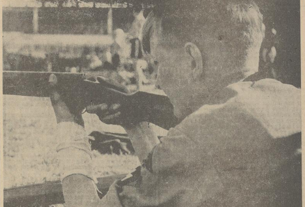
Sicheres Auge, sichere Hand!