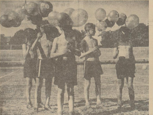
Kein „Massenballonstart“, sondern Zielscheiben für die Pimpfenschützen