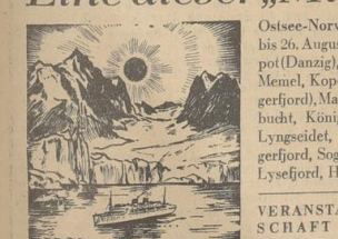
Mittlernachtszene auf Spitzbergen. (vgl. Abbild. den man nie vergessen kann.)