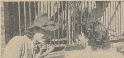
1. „Wetten, daß ich auch dressierte Tiger streicheln?“ fragt Hertha Feiler, die noch etwas ungläubige Hannelore Schroth.

Hertha Feiler kennt jeder als die mutige Tigerbändigerin Beatrice aus dem Varieté-Film der Terra: „Männer müssen so sein“. Ihr Tanz im Käfig, umgeben von furchendenden Bestien, gehört zu den erregendsten Szenen, die im deutschen Film je gedreht worden sind. Hat nun der Film den Mut der Darstellerin scharf übertrieben oder hat Hertha Feiler wirklich keine Angst vor Tigern? ... — Unsere Bilderreihe von einem Besuch im Berliner Zoo gibt die Antwort.