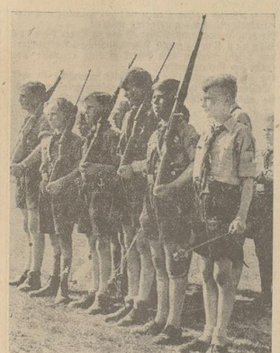
Die besten Luftgewehrmeister der Bremd Jungvolk-Fähnlein zum Wettbewerb angetreten

In achtstündigen Lehrgängen, bei gründlicher Durchbildung werden die Schützengewehr gefolgt und führen, bei beständiger Prüfung, als abnahmeberechtigt für die verschiedenen Schießausstellungen der Hitler-Jugend in ihre Einheit. Neben diesen Reichsjugendführern gibt es allerdings noch eine Möglichkeit, die Tausende von Schützern auszubilden. Gemeint sind die 53-Schießlehrer. Diese zweite Möglichkeit liegt allerdings noch in ihren Anfängen, da die Anforderungen an einen 53-Schießlehrer außerordentlich hoch sind. Damit wird allerdings auch das Ziel erreicht, daß nur solche Kameraden diesen Dienst ausüben, die bereits über ein gebildetes Maß von Können und Leistung verfügen.