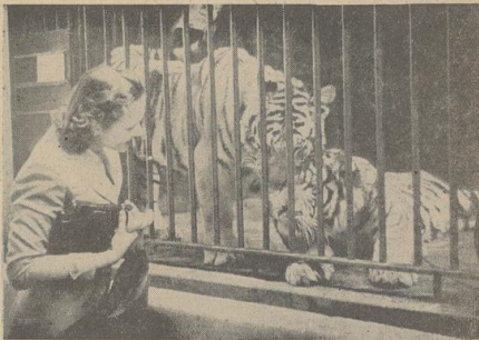
2. Vorsichtig greift die Hand durchs Gitter: „Komm, komm, sei brav. Ich will dich ja gar nicht fressen!“