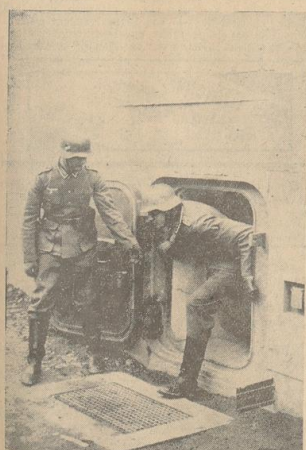
Neue Aufnahmen vom Westwall

Täglich fischet die Auslandsprelle ihren Lesern neue Lügenmärchen über den deutschen Westwall auf. Wir hoffen, daß diese Bilder unseren Freunden im Ausland die Bedeutung unserer Westbefestigung aus Beton und Stahl für die Verteidigung des Reiches veranschaulichen, und daß man die Sinnlosigkeit eines Angriffs gegen diese unnehmbare Verteidigungslinie einschätzt.