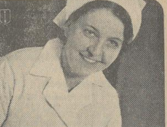
„Sehen Sie jung aus!“

Am 8. Juni 1939 wurde um 11 Uhr, in der Kapelle des Bremer Friedhofes.