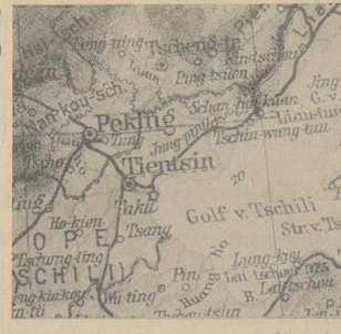
Deiche am Gelben Fluß geschlossen

Die japanische Außenpolitik wird nicht, sind zwei japanische Konsulatssekretäre Opfer des Mordanschlags bei dem Mord in Nanjing geworden. Beide Beamte hätten sich nach Genug des vergifteten Beines zum Auf- tritt der japanischen Gäste bemerkt und dadurch ihre eigene Behandlung verzögert.