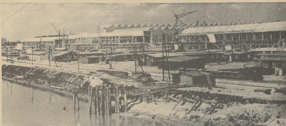
Am Mittellandkanal erhält das Volkswagenwerk einen eigenen Hafen

(Von unserem nach Fallersleben entsandten Sonderberichterstatter Georg Hinze)