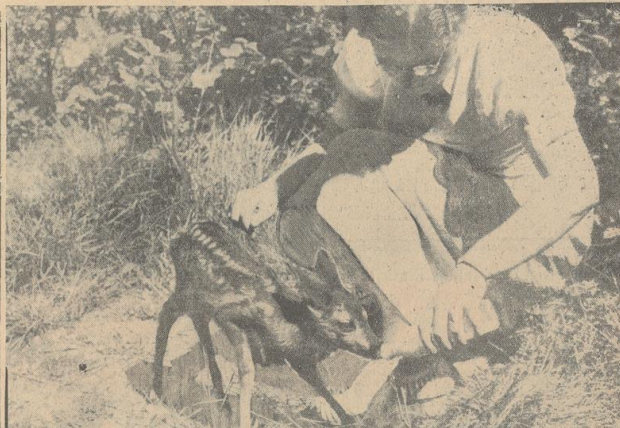
„Hänschen“ vom Schweizer Haus pflegt trotz seines zarten Alters mit ziemlicher Vehemenz zu trinken!

Rehgehege, das in der Nähe von Bremer Bürgerpark