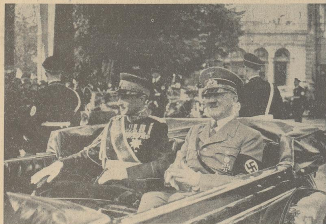
Der Führer geleitet seine hohen jugoslawischen Gäste vom Bahnhof zum Schloß Bellevue. Gestern trafen auf dem Lehrter Bahnhof Prinzregent Paul von Jugoslawien und Prinzessin Olga zu einem mehrtagigen Besuch in der deutschen Reichshauptstadt ein. Unser Bild zeigt den Führer und Prinzregent Paul vor dem Brandenburger Tor auf der Fahrt zum Schloß Bellevue.