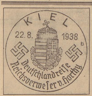
Kiels Sonderstempel zum Besuche Horthys Die Reichspost hat für die Zeit der Deutschlandreise des ungarischen Reichsverweyers für die Stadt Kiel einen Sonderstempel herausgegeben.