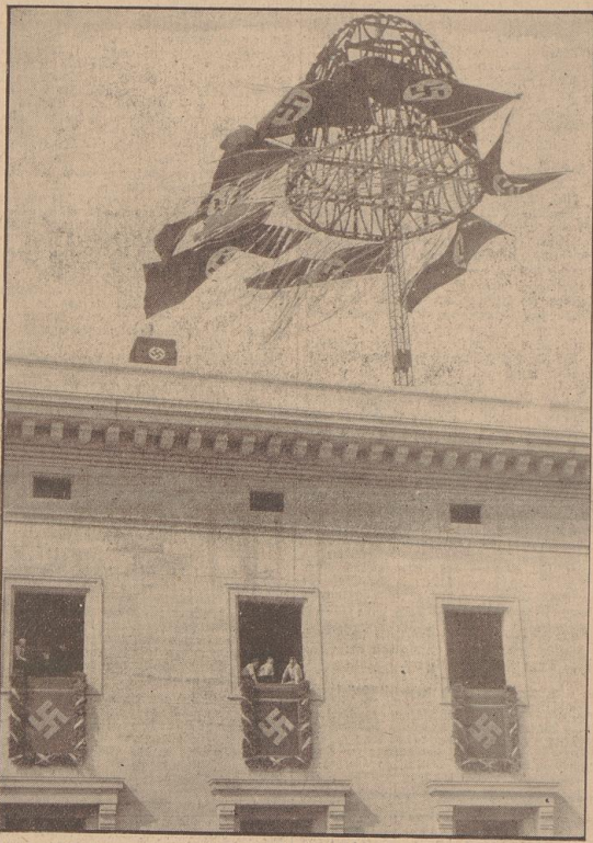
Richtfest am Erweiterungsbau der Reichskanzlei. Einer der Arbeiter, der an dem Bau mitgewirkt hat, sprach während der Feier vom Dach des Erweiterungsbaus aus.

Die Schlußworte eines Arbeiters gehen fast in stolzem Jubel der Bauarbeiter um den Führer unter. Nachvollt Jubel der Siegelheute und die Wieder der Nation durch die weite Halle. Begleitet von bewegten Dankschreien der Arbeiter verläßt der Führer die Reichshalle und verläßt der Führer wieder das Richtfest.