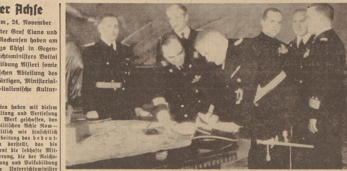
Bildtelegramm aus Rom: Der deutsche Botschafter v. Mackensen bei der Unterzeichnung des deutsch-italienischen Kulturabkommens.

Die deutschen wissenschaftlichen Institute in Italien wie auch ihre Leiter und Beamten erhalten durch das Abkommen eine vortrefflich anerkannte Grundlage.