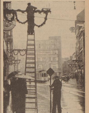
Auf schwankender Leiter bei Sturm und Regen erstreckt die weihnachtliche Ausschmückung der Straßen

Bereits haben sich schon Schulfrauentreffen an das festliche Weihnachtsfest. Giltende Kugeln, leuchtende Sterne und buntes Laternenfest geben festlich mancher Stadt das gezeichnete Gepräge eines weihnachtlichen Fests. Auch ein anderes ist es, das uns daran erinnert, daß unter Einzelhandel, der schon in den letzten Tagen der Weihnachtsfeierlichkeiten, das Fest der Vorbereitungen für Weihnachten, das Fest der Vorbereitungen für Weihnachten, das Fest der Vorbereitungen für Weihnachten.