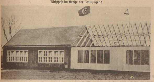
Der Schulneubau in Habenhausen wurde in hiesiger Halbbauweise errichtet. (Aufz. Sommer '37)

Im Kreis der Schuljugend von Habenhausen wurde am Mittwochsabend ein schmaler Schulneubau an der Eintrachtstraße in Habenhausen, den 1933 bis 1936 reichlich Geldes, so lagte Ba. Siedfeld, zu Beginn des Jahres 1938, war noch nicht fertig. Die Bauarbeiten wurden durch die Bauverwaltung des Kreises Habenhausen durchgeführt. Der Schulneubau wurde in hiesiger Halbbauweise errichtet. Die Bauarbeiten wurden durch die Bauverwaltung des Kreises Habenhausen durchgeführt. Der Schulneubau wurde in hiesiger Halbbauweise errichtet. Die Bauarbeiten wurden durch die Bauverwaltung des Kreises Habenhausen durchgeführt.