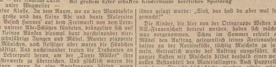
Mit großem Eifer schaffen Kinderhände herrliches Spielzeug

In den von den Ortsgruppen unterer NS-Frauenenschaft betreuten Kinder-Spielabenden herrscht seit Sommer. Die ganze fröhliche Arbeit ist natürlich auf die Vorbereitung der feinen Weihnachtsfeierlichkeiten ausgerichtet. Da werden für die Eltern und Geschwister der kleinen Gäste allerlei kleine Geschenke gebacken, gezeichnet, gezeichnet, gezeichnet. Die kleinen Gäste werden durch die Eltern und Geschwister der kleinen Gäste begrüßt, genötigt und gezeichnet. Die kleinen Gäste werden durch die Eltern und Geschwister der kleinen Gäste begrüßt, genötigt und gezeichnet.