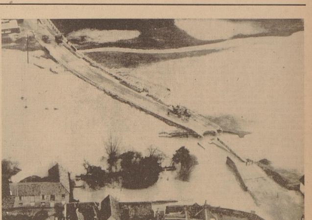
Riesige Überschwemmungen in England. Die großen Überschwemmungen, die in der letzten Zeit — wie berichtet — viele Teile Englands bedrohten, haben in Ipswich zu einer Katastrophe geführt. Der Fluß, der nur an zwei Stellen Durchfluß hatte, trat über die beiden Dämme hinweg, überschwemmte das dazwischenliegende Land und durchbrach mit voller Kraft die breite Brücke.

Die Versuche ergaben, daß Roggen- und Weizenstroh für die Zellulose gut geeignet sind. Für die Bearbeitung wählte man das sogenannte Sulfatstroh, bei dem der hohe Alpengehalt des Strohes herabgesetzt werden kann. An einer besonderen Großanlage gelang es ferner, allgemein die Geruch- und Staubbildung zu beseitigen, deshalb können jetzt auch in fast beliebigen Mengen Zellulosefabriken errichtet werden. Die folgenden Zellulosefabriken erprobt auch die unmittelbare Verarbeitung des noch leuchtenden Zellulose zu Kunstseide und Zellulose. Dies bedeutet einen weiteren Schritt zur Qualitätsverbesserung der deutschen Textilindustrie.