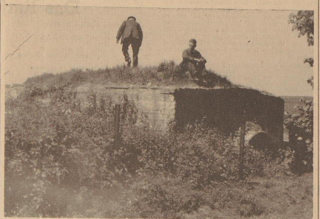
Deutsche Kriegsteilnehmer auf Flandernfahrt. Auf einem Ballonabgesichtsstand im Aufmarschgebiet.

Als nach einer halben Stunde das Toben der Elemente vorüber ist, taumelt mit den wenigen Lieberlebenden auch der britische Generalstabler über die letzten Reste der halbverbrannten Ballonhülle, über gepulverte Gaslöcher aus dem Bereiche des laufenden Flammenmeers zur Straße hinüber, wo die ausgebrannten Wagen einer Munitionskolonie umgewälzt liegen. Sie führt als Reizehen eine schwarze Kette im weißen Felle, und tote Körper liegen mit verkrampften