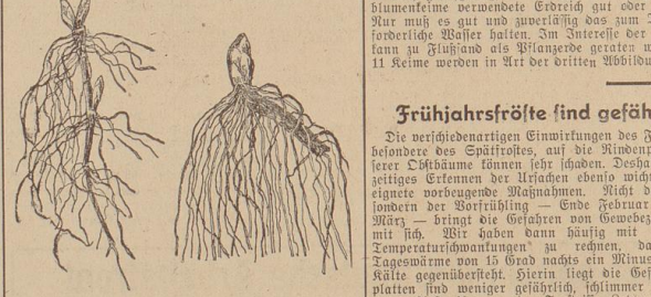
Links: Pflanzkeime des Maiglöckchens. Rechts: Zur Frühreibe geeigneter Maiglöckchen-Topfblücker.