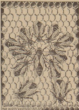
Die Wirtschaftsprüfung... Mitter-Königin, im Halbkreis: Arbeiterinnen...