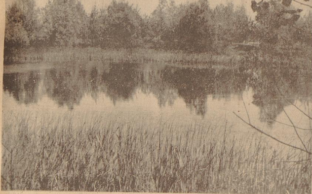
Krieg? Wem kommt bei diesem in annuiger Landschaft liegendem kleinen See die Erinnerung an schwere Kämpfe in Flandern? Und doch! Die Natur mit frischem Wachstum überzogen. Der See ist ein Minenrichter.

um im Schlamm nicht zu verlaufen wie die Regen. Wirt schon das Nachmittage, dem der britische Commodore vorgelassen in Calais solchen Erfolg prophezeite? Bis an die Arie stehen die Männer im eigenen Wasser. Einer haut mit dem Seltengewehr in die Straie. Die fette Waite wird angestrichelt und spinnat mit langem Sah über die Dedung. Woher kommen nun plötzlich die ellen, langschwänzigen Mager? Gaben sie gar Weichen angelesen? Die Nacht ist empfindlich kalt, und unbeherrschbar mit hundertfachen Licht fliegen die Sterne. Hier morgen früh ist der Angriffsbefehl da. Es bleibt keine Wahl mehr, es gibt kein Zurück —