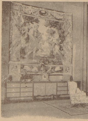
Erweiterungsbau der Reichskanzlei Berlin. Architekt Professor Albert Speer; Arbeitszimmer des Führers.