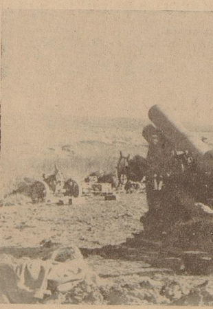
Der Vormarsch Francoes in Katalonien haben zu großen Erfolgen geführt. — Unsere Aufnahme zeigt eine nationalspanische Batterie im „Egre-Abschnitt.“