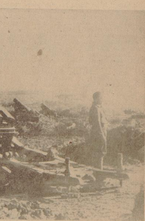
Die Operationen der Franco-Truppen in Katalonien Aufnahme zeigt eine nationalspanische Batterie im „Egre-Abschnitt.“