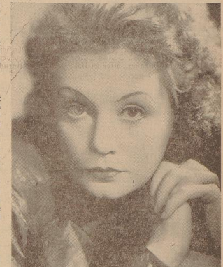
In diesen Tagen geht der neue Film mit Zarah Leander unter der Spielleitung von Professor Carl Froelich ins Atelier. Der neue Film behandelt eine Episode aus dem Leben Tschaikowsky und trägt den Titel „Es war eine rauschende Ballnacht“