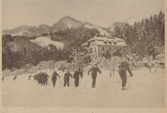
Die neueröffnete SA-Gruppenschule „Südmark“ in Aflenz. Dort finden vom 27. bis 29. Januar die großen Winterverehrungen der SA-Gruppe Südmark und die Gebietsmeisterschaften der Hitler-Jugend statt. 22000 Männer treten an.