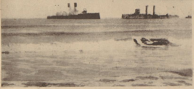
Nach dem mißglückten Angriff auf Zebrügge. Die auf Grund gesetzten britischen Sperrkreuzer

Nach dem Weltkrieg übernahm Richter zwar noch die Leitung des Konstruktionsdepartements. Die neue verbesserte Marine baute zunächst für den bevorstehenden und verdienten Mann seinen geeigneten Wirkungskreis wieder und er verließ sie am 25. November 1919 durch Verleihung in den einstweiligen Ruhestand. Seine jüngeren, noch jetzt in der Marine tätigen Mitarbeiter glauben, der Geist des bedeutenden Mannes treu bewahrt zu haben, und hoffen, daß er mit ihnen das Ergebnis seiner Lebensarbeit in dem Aufbau der neuen Flotte wiederherstellen sieht. Seine Verbundenheit mit dem neuen Aufbau trat deutlich in Erscheinung, als ihm die Schiffbauabteilung der Flottenabteilung im November 1935 ihre höchste Auszeichnung, die goldene Medaille überreichte.