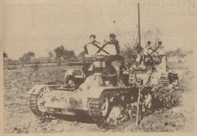
Der Vormarsch Francos in Katalonien: Von den nationalspanischen Truppen in der Gegend von Lerida eroberte Tanks der Roten.

Von den bisherigen üblichen Einzelhandelsunternehmungen in Bremen verfahrenen 24 reiflos, während 9 in arische Hand übergingen. In Lesum erlösch ein Händler seinen Bruder.