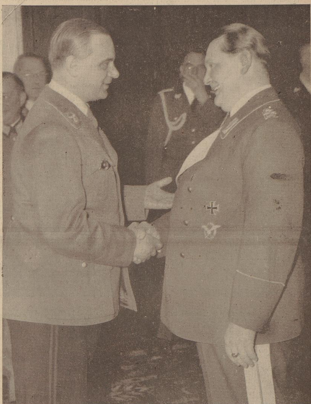
Zwei getreue Erfolgsmänner des Führers feiern heute Geburtstag. Ein Bild von der vorjährigen Geburtstagsfeier, als die Jubilare, Hermann Göring und Alfred Rosenberg, einander beglückwünschten. Beide wurden am 12. Januar 1893 geboren.

In Südamerika selbst unterhält die Lufthansa in Lima eine Zweigstelle. Deutsche Maschinen kommen auf der meisten Strecke des dichtesten südamerikanischen Luftverkehrs zur Verwendung. (Fortsetzung auf Seite 2)