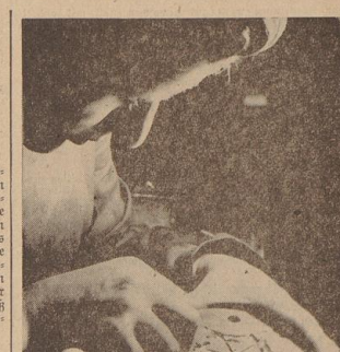
Ein kommende Werkstoff — Edelkunstharz. Mit feinsten Stacheln wurde die Stahlform mit den eingesenkten Figuren bearbeitet...