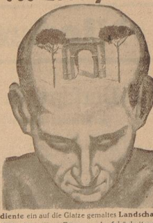
diente ein auf die Glatze gemaltes Landschaftsbild den alten Römern als Schönheitsersatz