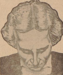
die Perücke mit Zopf