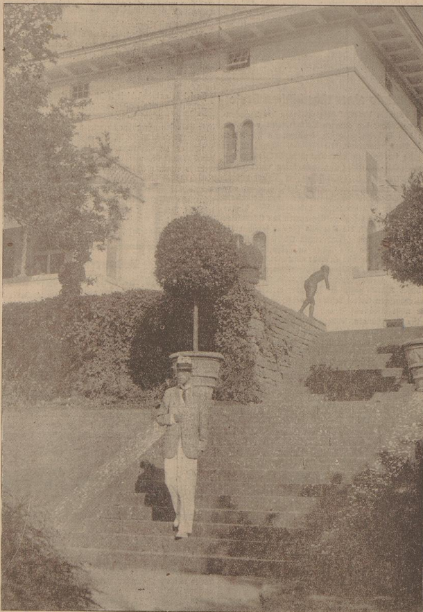
Schwedens König wird am 16. Juni 80 Jahre. Einen großen Teil des Jahres verbringt der König in seinem schön gelegenen Schloß Sollden bei Stockholm. [Presse-Hoffmann]

Das Schreiben schließt mit: „Wenn wir Ihnen in „Renzor“ veröffentlichten E. drücken trotzdem einmühen können, daß aus die Bürgerhaft deutscher Volks- zugehörigkeit der Arme gegenüber ein durchaus befrie- digendes Verhalten an den Tag legt, so daß also die Arme von sich aus offenbar keinen Grund zur Verärgerung findet, so erwidern wir in dieser Hinsicht einen neuerlichen Beweis für die beispielhafte Disziplin, der die deutsche Bevölkerung aus unter den gegenwärtigen angereicherlichen und überaus trübenden Umständen bisier fähig war. Die Sudetendeutsche Partei hält es für notwendig, Sie, Herr Minister, von diesem ihrem Standpunkt in Kenntnis zu setzen.“