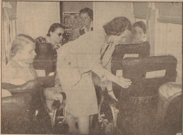
Die ersten „fliegenden Mädchen“ der Deutschen Luft-Hansa. Auf verschiedenen Flugtrecken führt die Deutsche Luft-Hansa in diesem Sommer erstmals Luftstewardessen ein. Die „fliegenden Mädchen“ lernen die Sitze für die Fluggäste fachgemäß herzurichten.

Inskip sagte darauf, er habe so klar gesprochen, wie er habe sprechen können. Man erwartet allgemein, daß die Opposition den Antrag stellen wird, eine allgemeine Aussprache über diese Frage herbeizuführen.